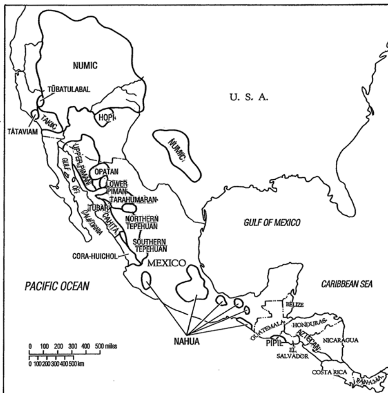
MAPA 1 Distribución de la familia yuto-azteca (Campbell, 1997: 358)

como polisemia, casos particulares de heterosemia (extensiones a partir de derivaciones o composiciones (Lichtenberk, 1991: 480)), incluso significados ambiguos o figurativos 2 . No obstante, en todos los casos es evidente que las asociaciones que se originan en el cuerpo humano y los sentidos traspasan el dominio de la percepción física y concreta, a marcos cognitivos intelectuales y abstractos, incluyendo la percepción de emociones.