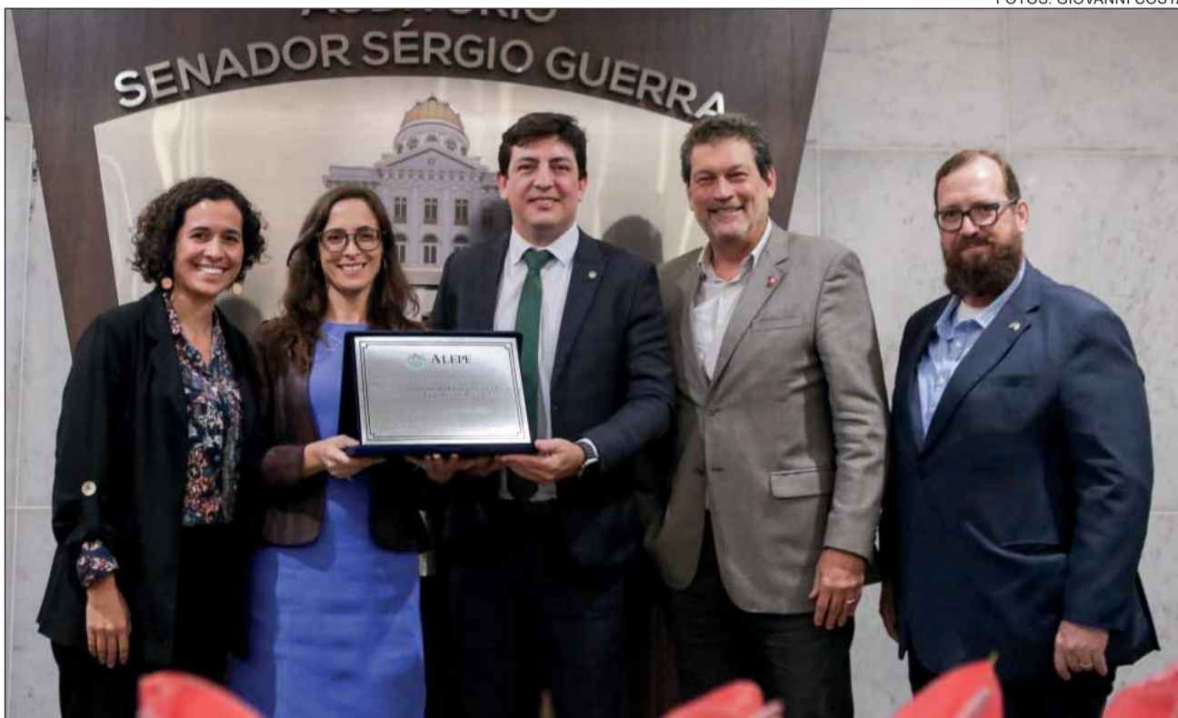
HISTÓRIA – Data é celebrada para recordar a Declaração de Iguazu, tratado assinado por Brasil e Argentina em 1985