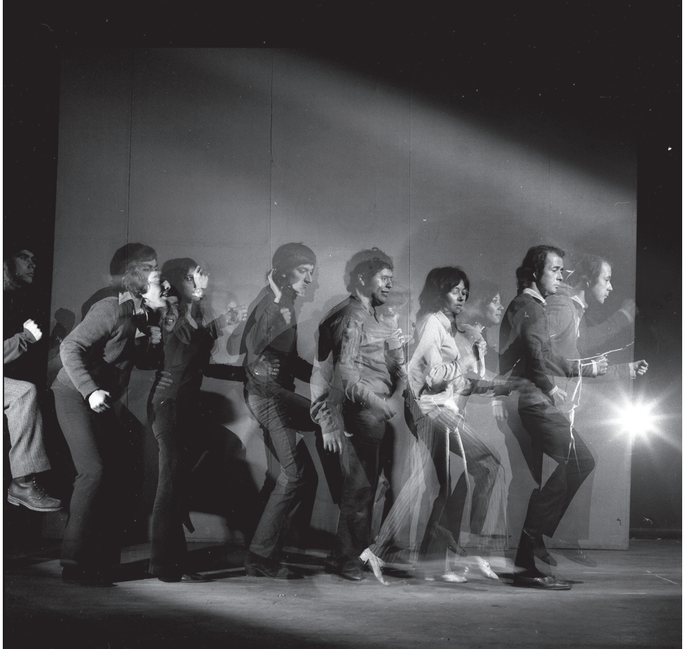
Cuántas ruedas tiene un trineo. Año: 1971. Fotografía de Juan Domingo Marinello. En Archivo de la Escena Teatral UC y www.chileescena.cl

Haber vivido en los campos de concentración creó en nosotras lazos y raíces tan fuertes que se quedaron para siempre en nuestras biografías, en un antes y un después. Marietta, compañera, hoy estamos aquí para decir adiós a tu secreta lucha de mujer sensible y artista, a tu profunda sed de justicia, que no pudo ser satisfecha en la justicia de los hombres. Decir adiós a tu necesidad de respuestas, sin respuesta, que todavía espera un nuevo día (“Carta a Marietta”).