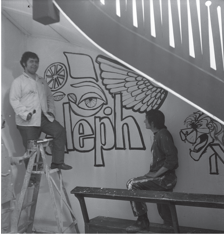
Teatro Aleph en Lastarria 90.

Rápidamente, con la ayuda siempre presente de los amigos y sus amigos, los alephianos fueron pintando y afirmando muros, levantando una pequeña sala de espectáculos, Lastarria 90, un teatro de bolsillo, con un mínimo escenario y unas cuarenta sillas dispuestas para el público. Cuando los trabajos estuvieron terminados, comenzando la fiesta inaugural, los alephianos colgaron en el frontis de la antigua casona una bandera azul: Teatro Aleph.