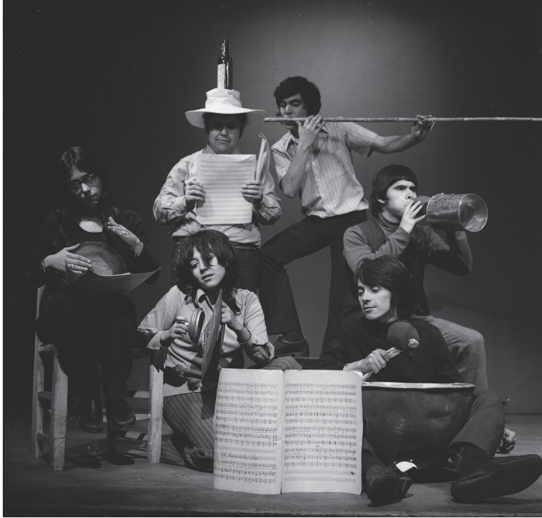
Cuántas ruedas tiene un trineo. Año: 1971.

se produjo a propósito de Cicuta , nuestro programa de televisión. Nosotros queríamos hacer un teatro más político, no panfletario, pero más comprometido con la realidad del país que lo que hacíamos con el Aleph. Nos fuimos al Viridis, simbólicamente, porque en realidad nos llamamos Brocha Gorda. Con este grupo, al cual se integraron otros amigos, solo hicimos una pieza. No pasó gran cosa con esta creación, pero la única cosa positiva, creo yo, fue que en ella nosotros adelantábamos exactamente lo que luego ocurrió en Chile. Teatralmente la pieza era mediocre, pero al menos nuestro análisis había sido correcto (Ricardo Vallejo).