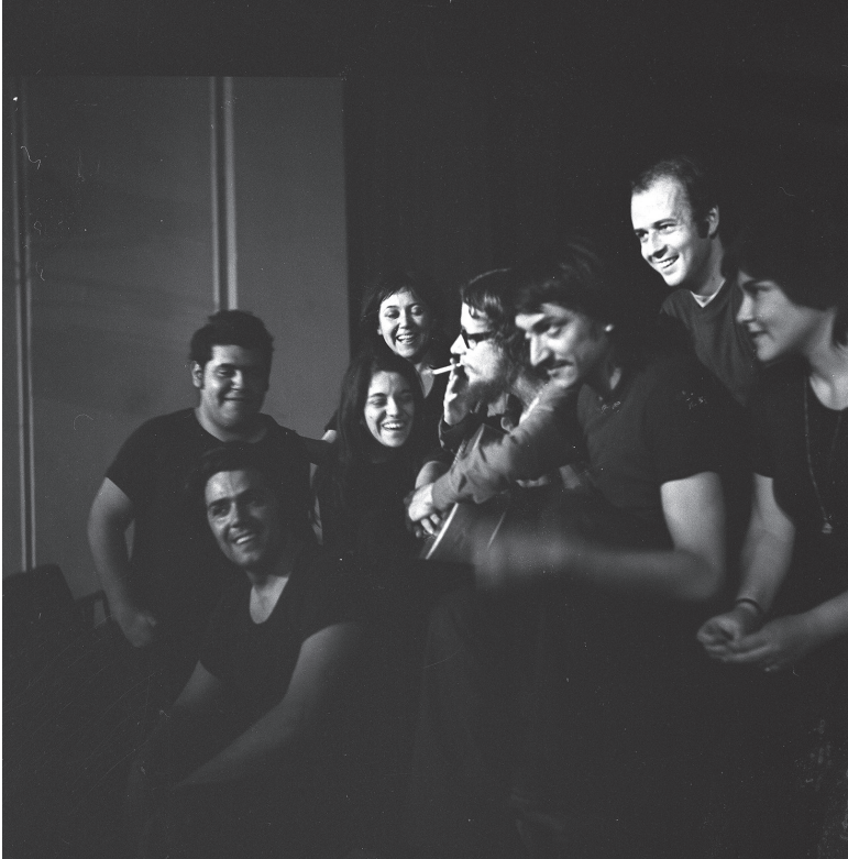
Teatro Aleph junto a Jerzy Grotowski.

Pocas veces los hombres necesitaron tanto como ahora de fe en sí mismos y en su capacidad de rehacer el mundo, de renovar la vida... La tarea es de complejidad extraordinaria porque no hay precedente en que podamos inspirarnos. Pisamos un camino nuevo, marchamos sin guía por un terreno desconocido; apenas teniendo como brújula nuestra fidelidad al humanismo de todas las épocas —particularmente el humanismo marxista— y teniendo como norte el proyecto de la sociedad que deseamos, inspirada en los anhelos más hondamente enraizados en el pueblo chileno (Allende).