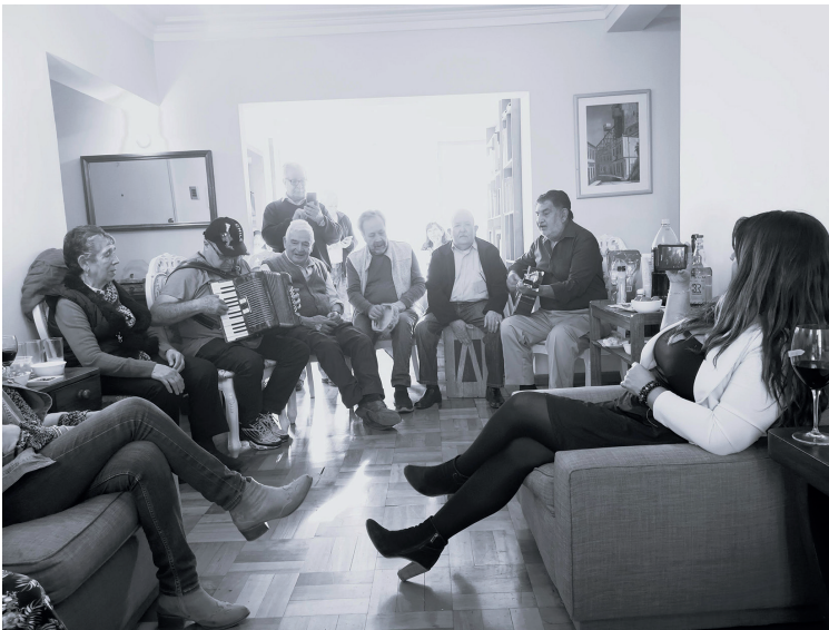
Encuentro grupal con exintegrantes de los conjuntos Chalinga y TESILACH. Santiago de Chile, 5 de septiembre de 2022.

mapeo colectivo), en donde se ubicó un papelógrafo con una línea de tiempo en blanco, y en donde los integrantes podían colocar “post it” con hechos y eventos significativos, tanto personales, relacionados con las agrupaciones (TESILACH y Chalinga), así como también asociados al contexto nacional.