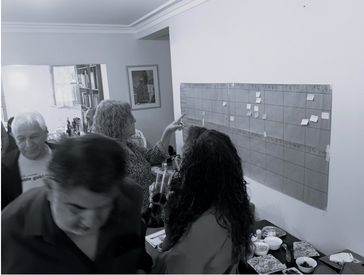
Desarrollo de línea tiempo con exintegrantes de los conjuntos Chalinga y TESILACH. Santiago de Chile, 5 de septiembre de 2022.